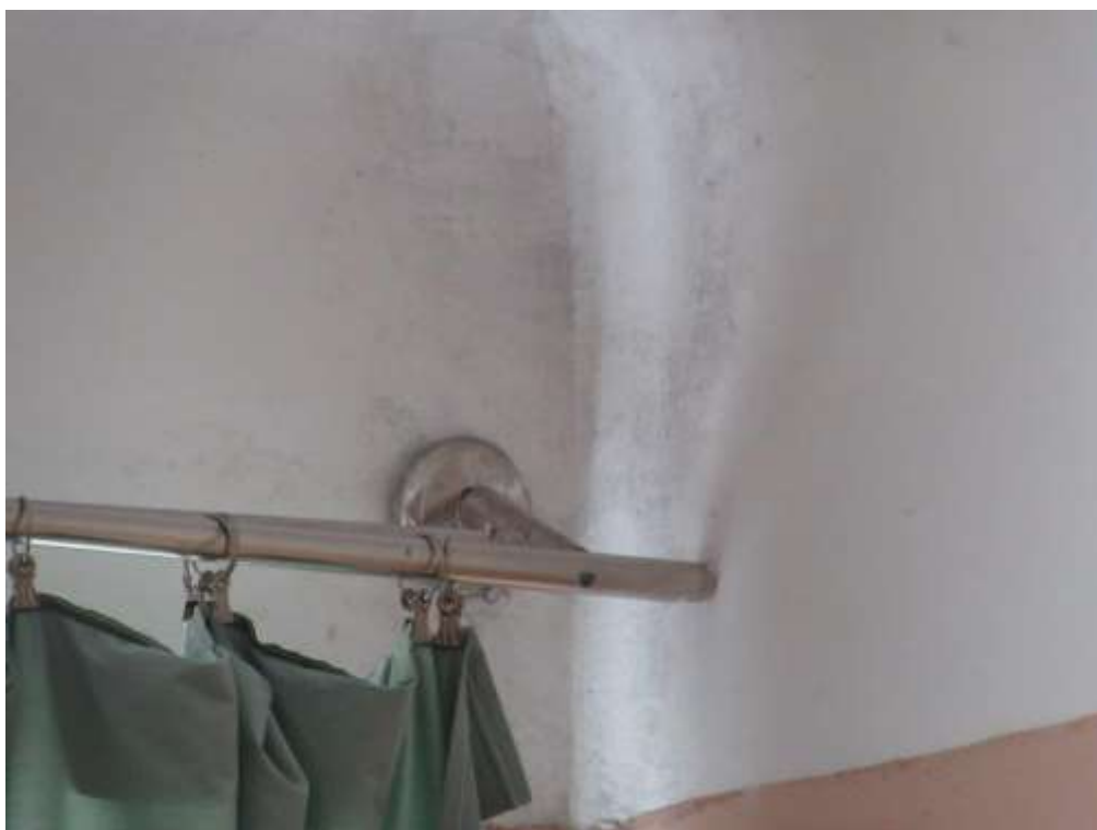
3.1.13.attēls. Pelējums istabu stūros