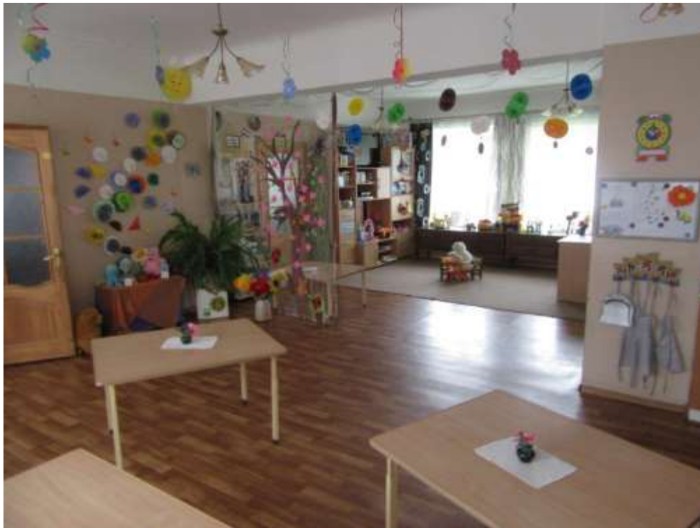
3.1.11.attēls. 2. stāva 20. telpa