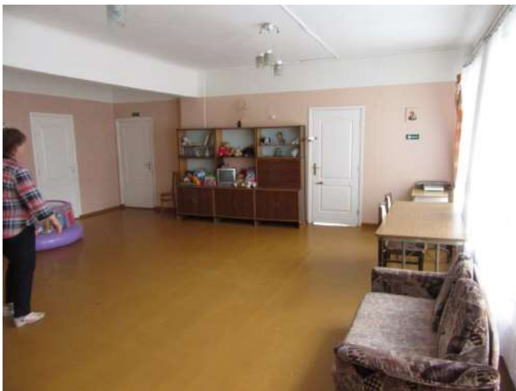
3.1.15.attēls. 2. stāva 3. telpa (bērnu istaba)