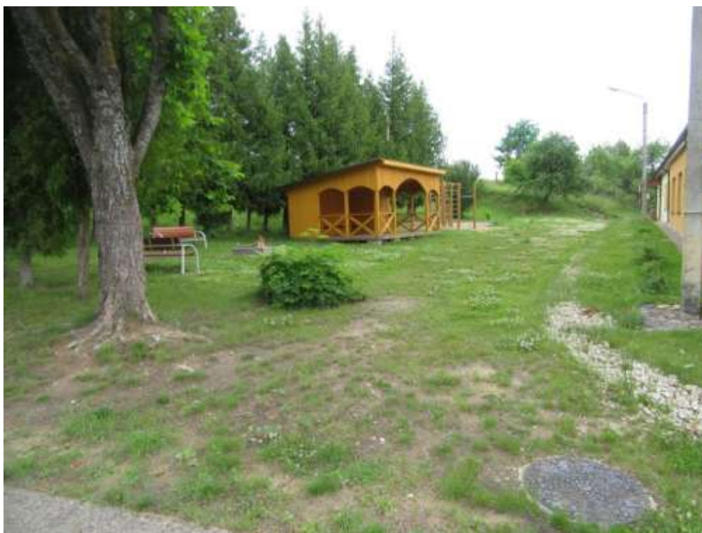
3.2.3.attēls. Atpūtas laukums blakus ēkai