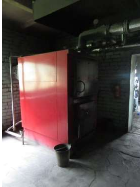
3.1.7.attēls. Katlu mājas iekārtas