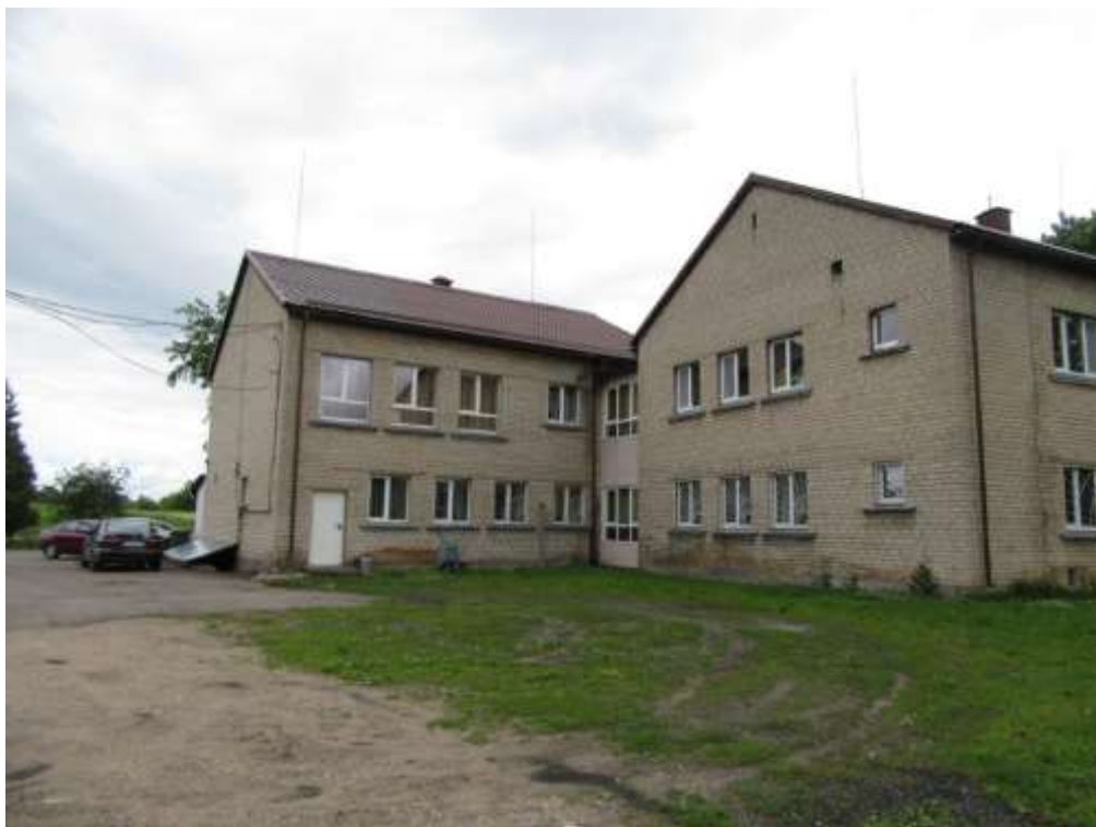
3.1.3.attēls. Bērnu nama ēkas fasāde (apmales ir nedaudz bojātās, sienas pie pamatiem cieš no paaugstināta mitruma)