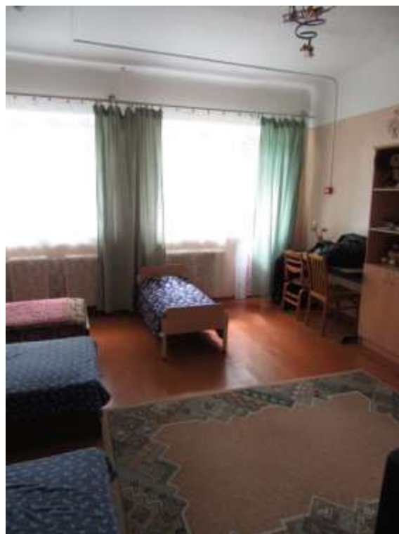
3.1.12.attēls. 2. stāva 20. telpa (bērnu guļamistaba)