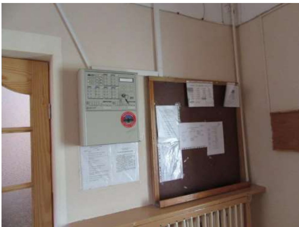
3.1.10.attēls. Ugunsgrēka atklāšanas sistēma