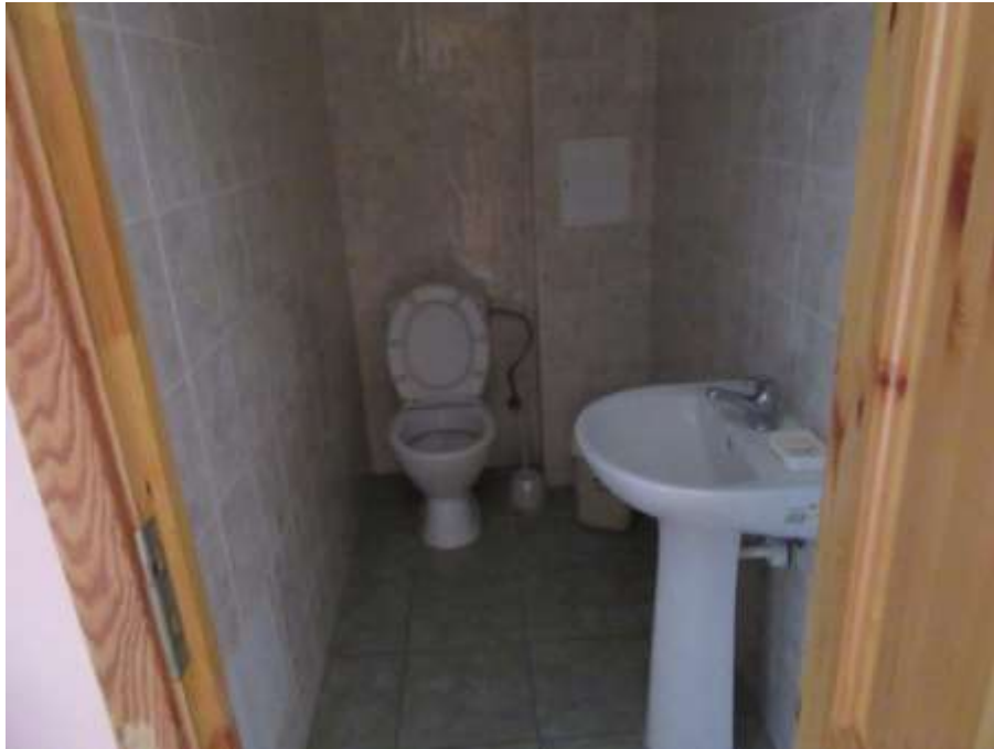
3.3.5.attēls. Sanitārais mezgls