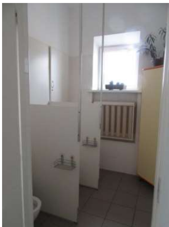
3.1.14.attēls. Sanitārais mezgls turpat