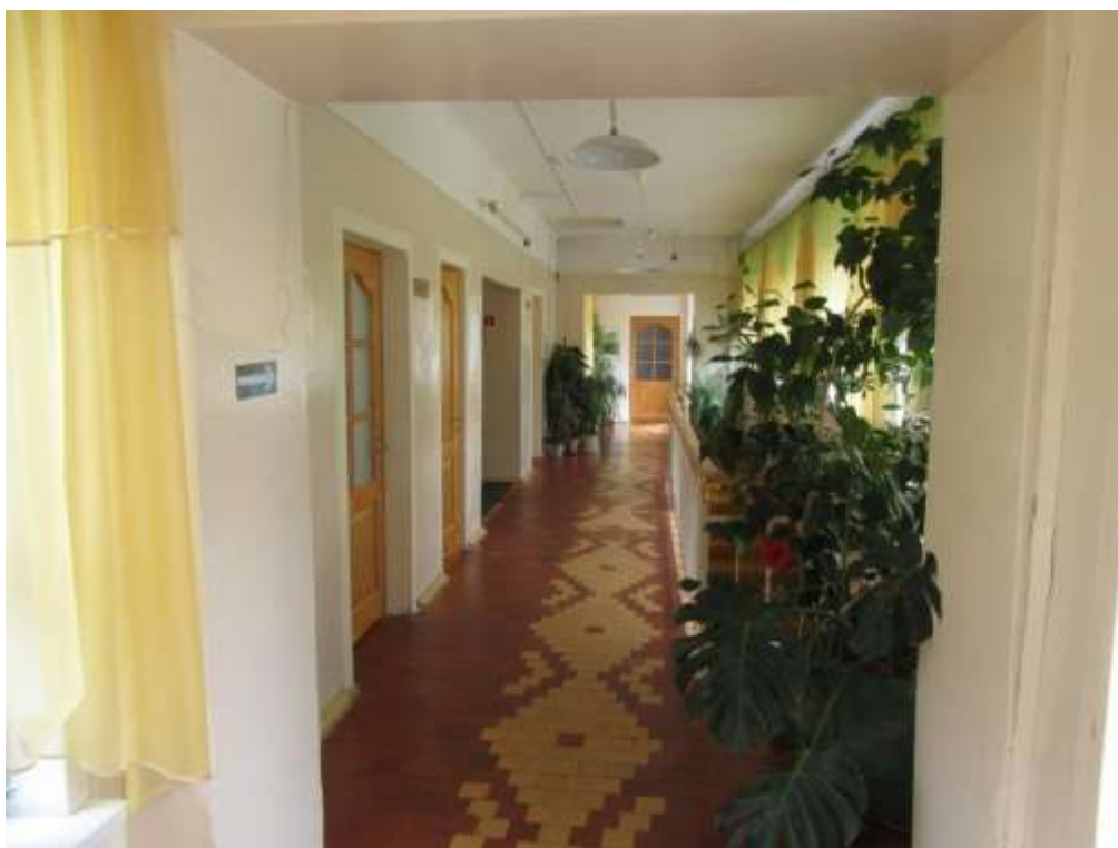
3.1.18.attēls. Koridors otrajā stāvā

3.2. BSAC ēka 381 m 2 . Kadastra apzīmējums 4474 006 0222 006.