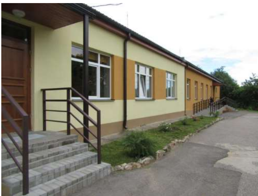
3.2.2.attēls. Ēkas fasāde