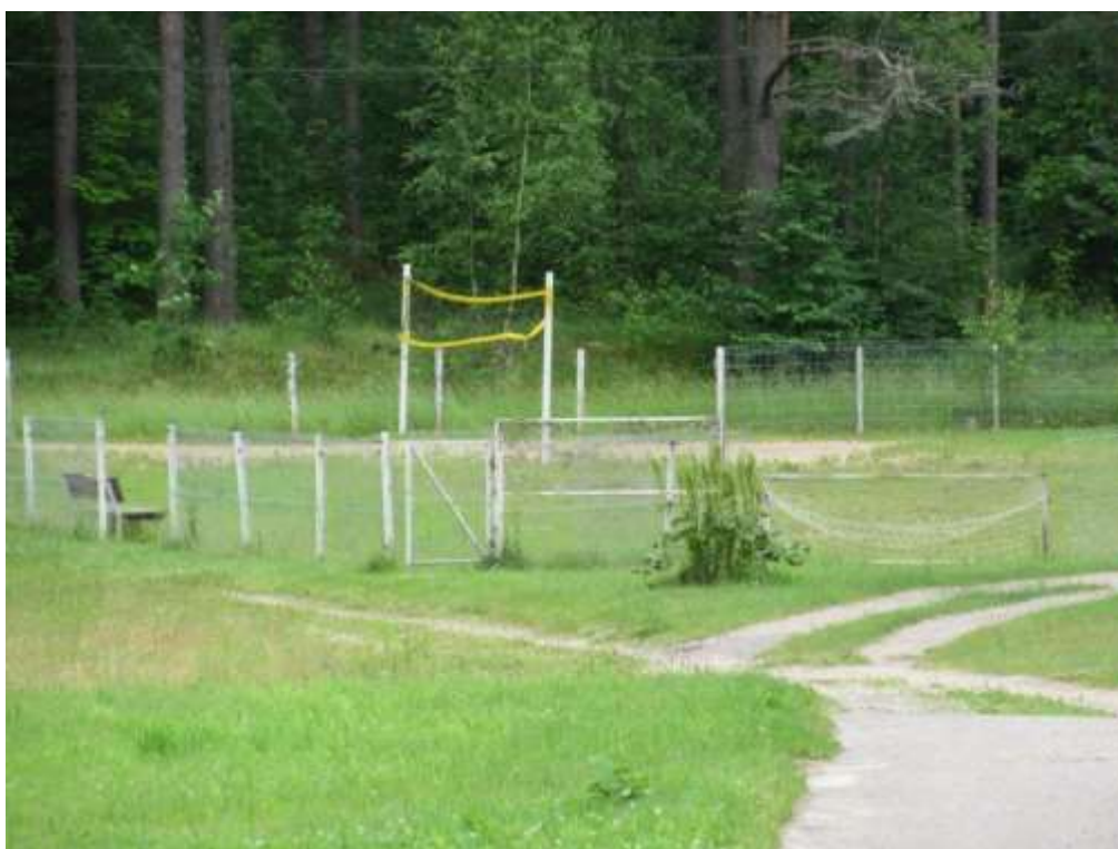
3.1.6.attēls. Sporta un rotaļu laukumi ar morāli un fiziski degradējušos infrastruktūru