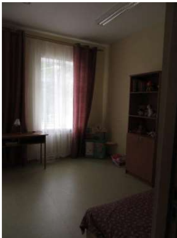
3.2.6.attēls. Bērnu istaba