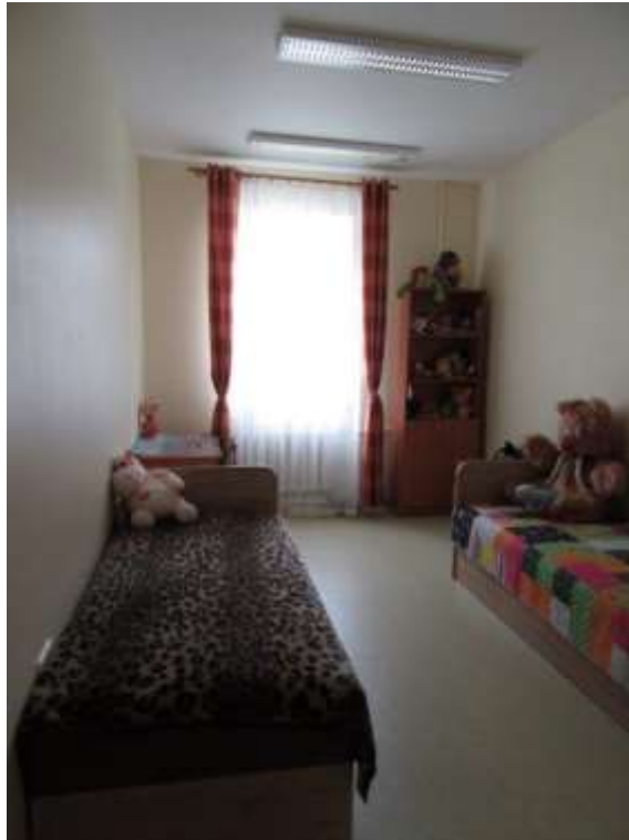
3.2.7.attēls. Bērnu istaba