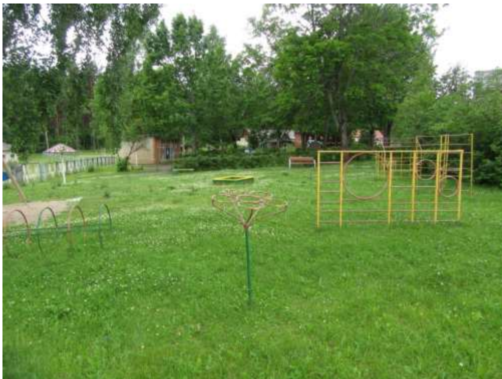
3.1.5.attēls. Sporta un rotaļu laukumi ar morāli un fiziski degradējušos infrastruktūru