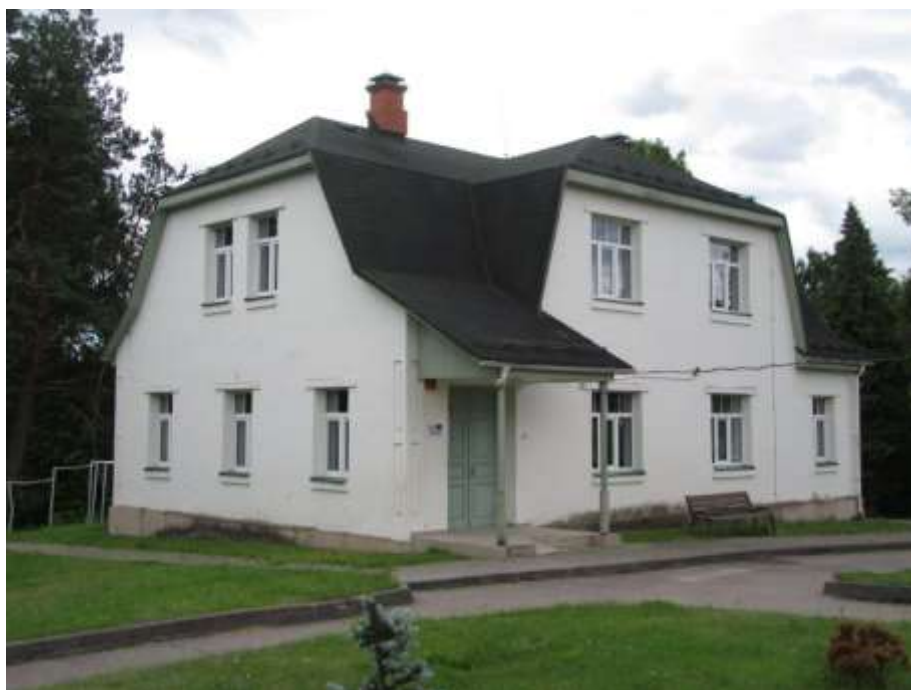
3.3.1.attēls. Ēkas fasāde

3.3. Naujenes BSAC ēka 236.9 m 2 . Kadastra apzīmējums 4474 006 0222 007.