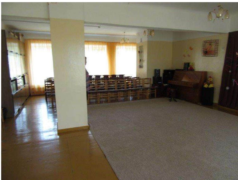
3.1.17.attēls. 2. stāva 14. telpa (aktu zāle)