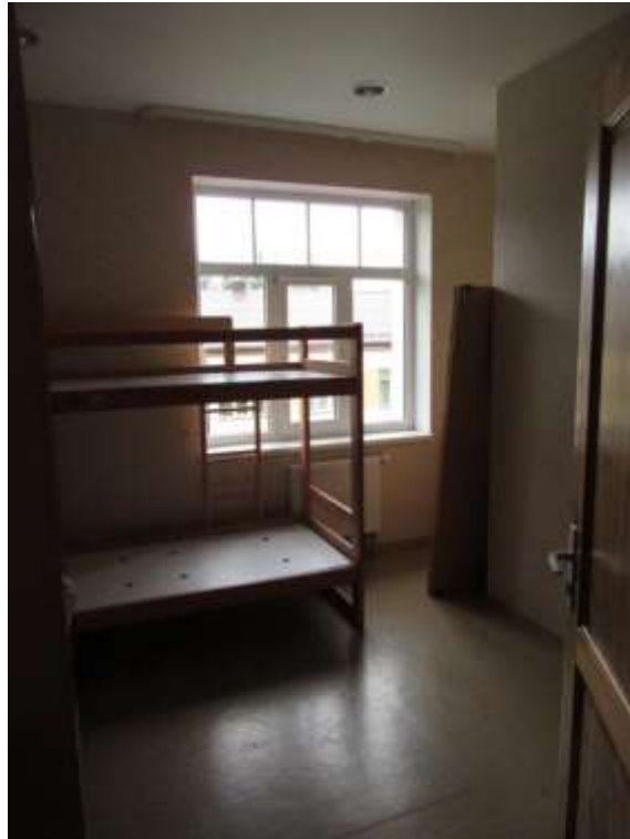
3.3.7.attēls. Bērnu istaba ēkas 2. stāvā