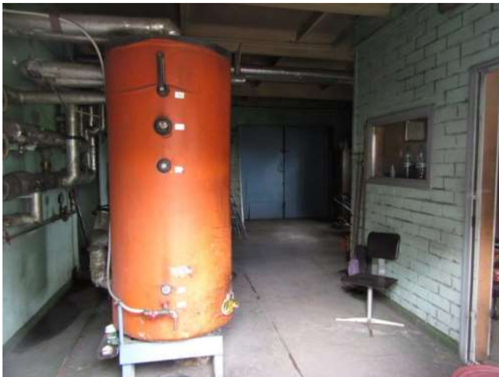
3.1.8.attēls. Katlu mājas iekārtas