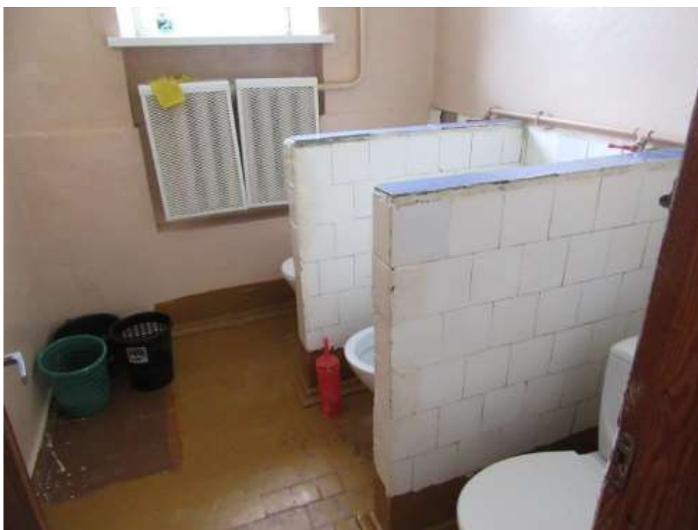
3.1.16.attēls. Sanitārais mezgls turpat