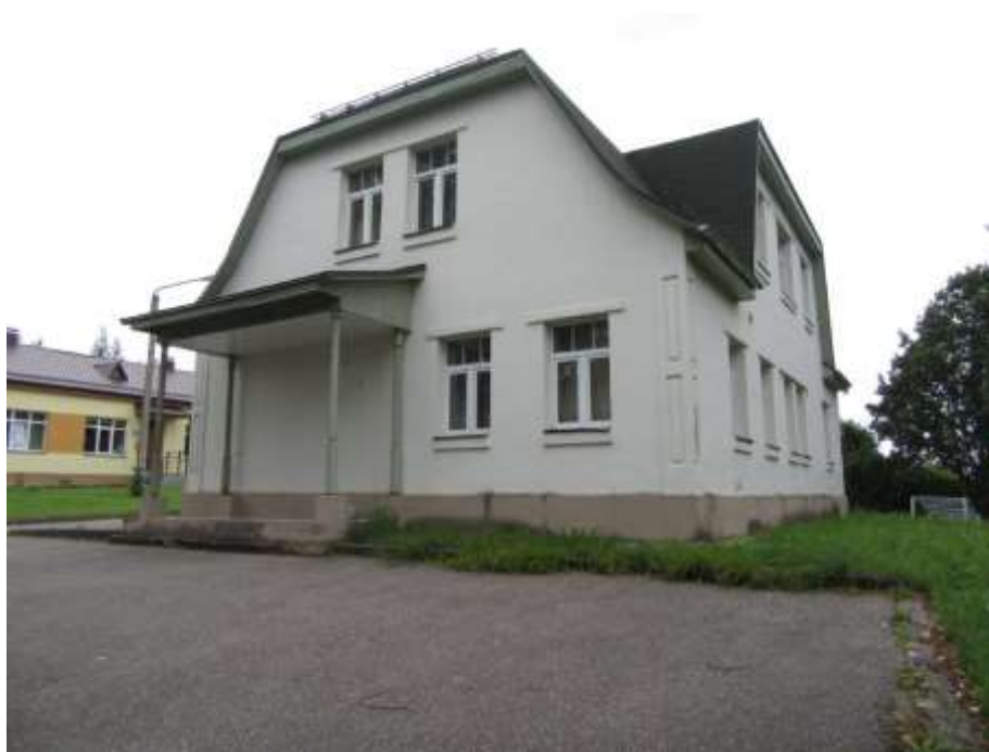
3.3.2.attēls. Ēkas fasāde