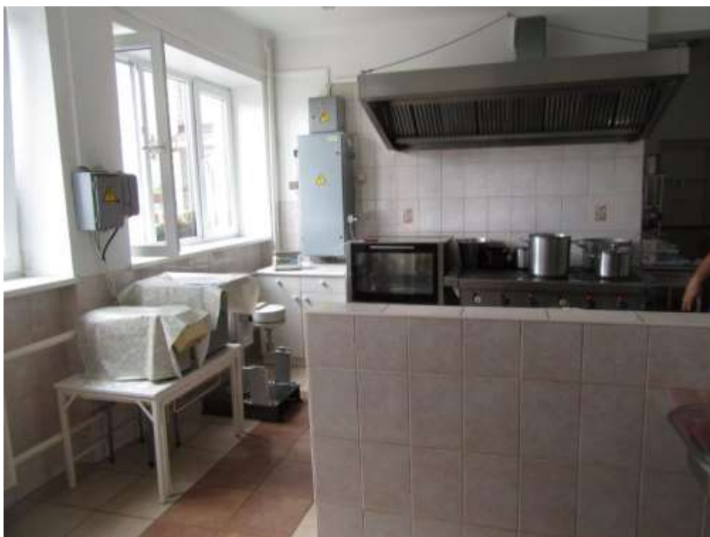
3.1.9.attēls. Virtuves bloks