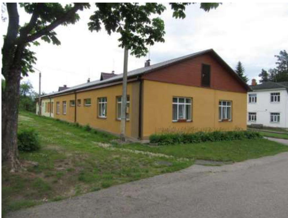
3.2.1.attēls. Ēkas fasāde