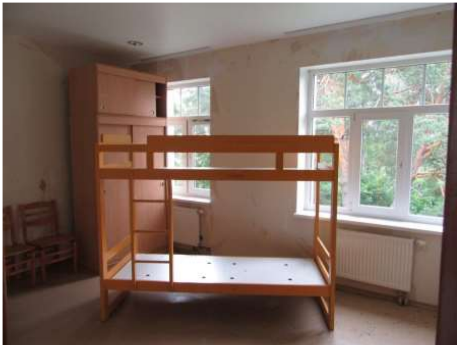
3.3.6.attēls. Bērnu istaba ēkas 2. stāvā