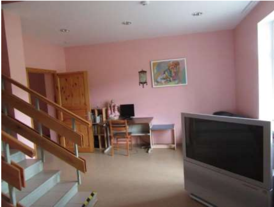
3.3.3.attēls. Atpūtas telpa ēkas 1. stāvā