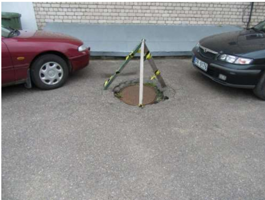
3.1.4.attēls. Bojāta kanalizācijas sistēmas lūka