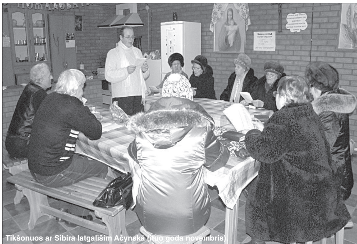
Tikšonuos ar Sibīra latgališim Ačynskā (ītuo goda novembris)

Nūteikti! Maņ cīši pateik vīna atziņa nu Krysta ceļa medītacejīs Vyssvātuokajai Jezus Sirdei: Mes bīži vīņ dzeivojam puorlīceibā, ka tik daudz doram Dīva lobā, tik cīši daudz paleidzam Jam pasaulā pestīšonā, tik daudz nu sevis dūdam Juo slavīs pavairošonai. Bet patīseiba par Dīva i mysu atteiceibom ir pavysam cytaida. Pat ja mes arī kū dūmam Kungam Dīvam, tei ir na myusu duovona, bet Dīva duovona mums. Ja mes upurējam Dīvam koč kū, tod tys nanūzeimoj, ka mes dolomēs ar Dīvu sovā īpašumā, bet gon upurējam Dīvam tū, kas jau taipat ir Juo īpašums. Dīvs taidā gadīnī ruda laipnu vaigu un nūpītni pījem "it kai myusu" upuri. I kotru myusu upuri Jīs svīetej, pavairoj, boguotyno i atgrīž myusim atpaķā. Ja kaidys upurēj Dīvam sovū dzeivi, tod taidys na Dīvu ar tū boguotyno, bet juo pošā dzeive klyst skaistuoka i vīerteiguoka. Vysī vysū sajem nu Dīva Sirds pīļneibys.