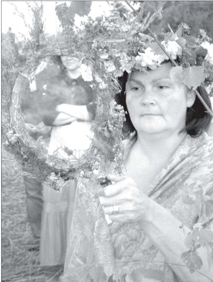
Saulis rīta vuortūs teik sadadzynuots paguojušu goda vainags.

22.juņa vokors nu jau ari tradicionāli trešū godu tyka ģeiguošonys Kruoslovys rajona Ezernīkūs. Sešūs vokorā beja nalels ierģeļu muzykys koncerts Bukmuižys draudzis bazneicā, a tod jau vysu vokoru i nakti muziciešona, dzīdu-